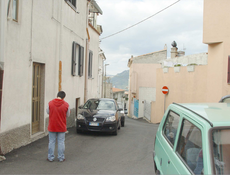
VIA MONTE GRAPPA