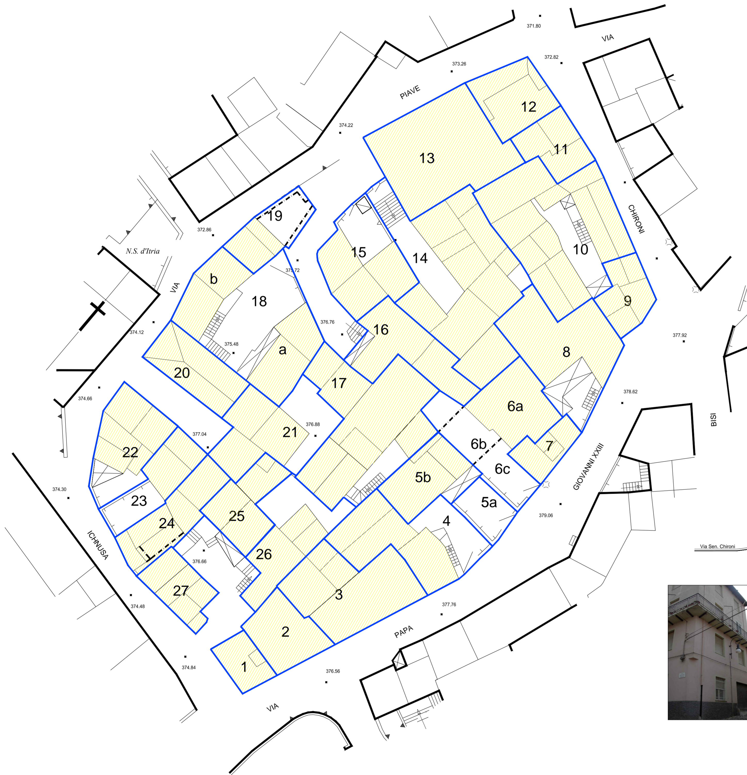
Prospetto su via Ichnusa