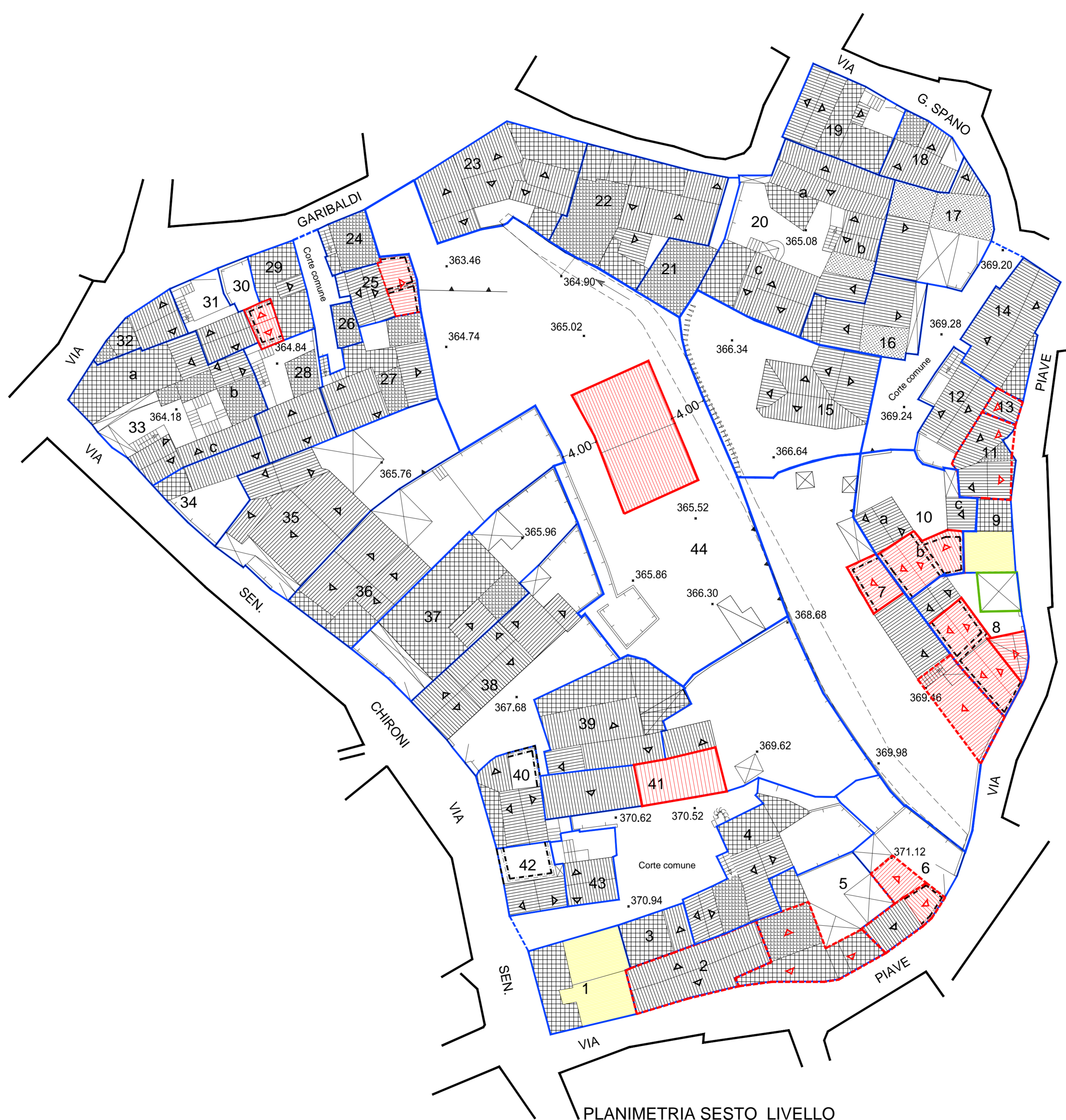
PLANIMETRIA SESTO LIVELLO